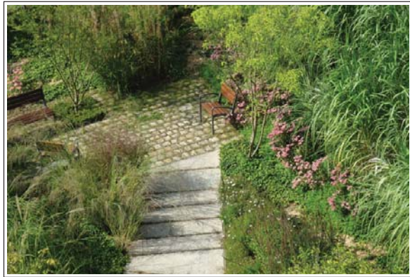
Jardin de l'Ancien Collège