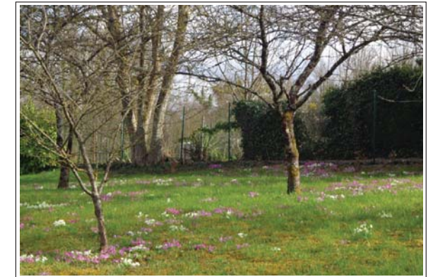
Vergers sur les hauteurs de Sézanne

Office de Tourisme de Sézanne et sa Région