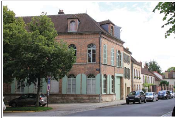
Rue du Capitaine Faucon