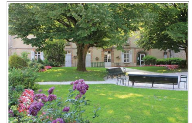
Jardin de l'Hôtel de Ville