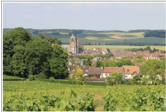
Panorama sur Sézanne