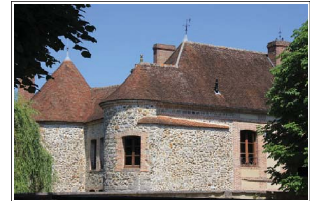
Vestige de la porte du Pied de Cane